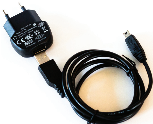
Chargeur (photo peut différer)